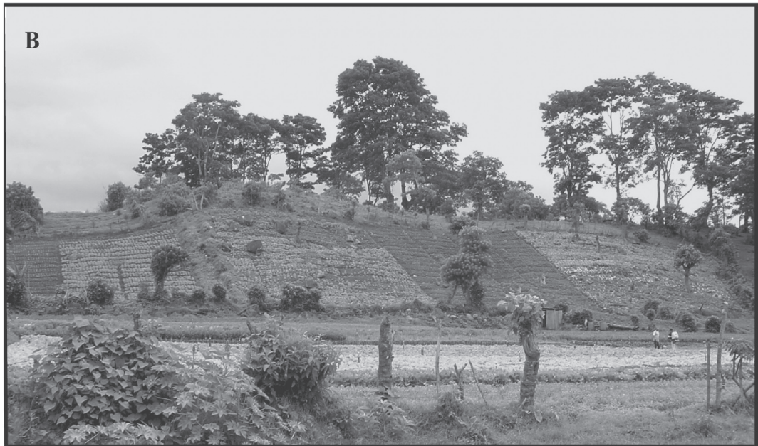
Fig. 6A: Mapa topográfico detallado del lomo de falla del este de Tejar y ubicaciones de trincheras y perfiles geofísicos. Curvas de nivel cada 5 m, tomadas de la hoja Tejar (1: 10 000) del IGN. El perfil de resistividad se muestra como una línea punteada (C-C', Fig. 7) y los cuatro perfiles magnéticos realizados a través del escarpe o al sur de él, se muestran con líneas sólidas. Los cuatro perfiles muestran un gradiente similar de N a S con una pronunciada anomalía sobre el escarpe, sugiriendo que el rumbo local tanto del escarpe como de la estructura regional, es E-W. QC es la quebarada Cangrejal. Fig. 6B: Fotografía de la loma L3 viendo al N tomada desde el punto 8.