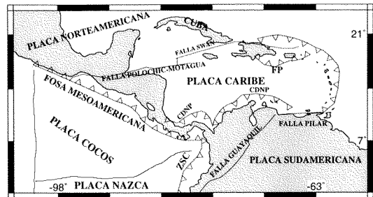
Fig. 1: Marco tectónico. FP: Fosa de Puerto Rico, CDNP: Cinturón Deformado del Norte de Panamá, ZSC: Zona de Subducción de Colombia (adaptado de Calais et al., 1992).

La región centroamericana y parte de las islas del Caribe, son parte de la placa Caribe. Esta placa se encuentra rodeada por las placas Cocos, Norteamericana, Nazca y Sudamericana (Fig. 1). Los tres límites tectónicos más importantes del área centroamericana son: La fosa Me-